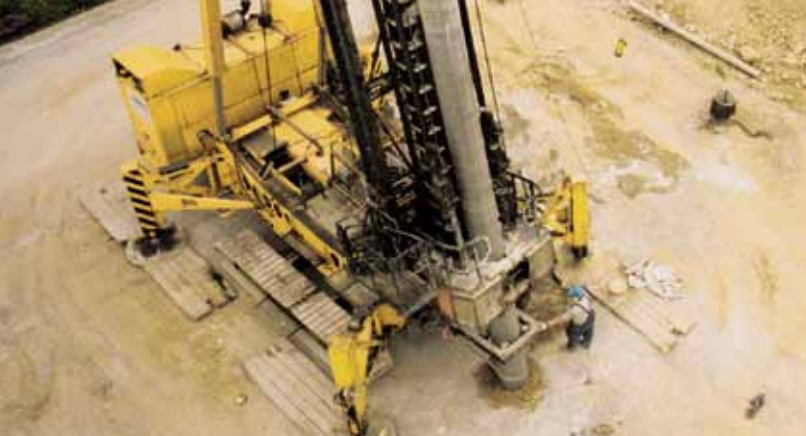
Einrammen/Ziehen des Vortreibrohres